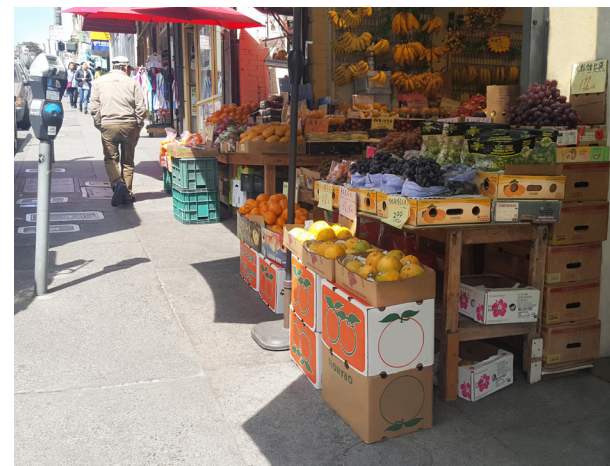
違規情況：超過許可的用途