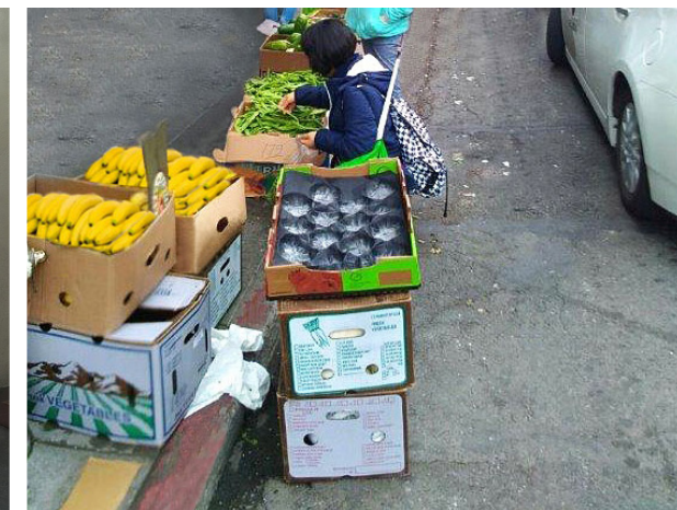
違規情況：不安全的情形